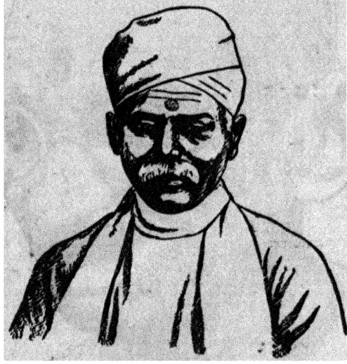
पंडित मदनमोहन मालवीय